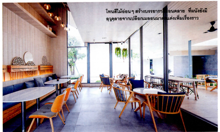
โทนสีไม้อ่อนๆ สร้างบรรยากาศผ่อนคลาย ที่ผนังยังมีลวดลายจากเปลือกเมลอนมาตกแต่งเพิ่มเรื่องราว