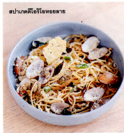
สปาเกตตีโอริโหอยลาย