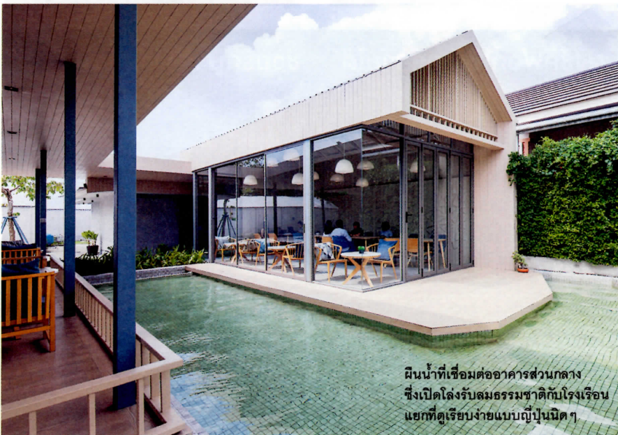
ผืนน้ำที่เชื่อมต่ออาคารส่วนกลาง ซึ่งเปิดโล่งรับลมธรรมชาติกับโรงเรือนแยกที่ดูเรียบง่ายแบบญี่ปุ่นนิตๆ

แม้ว่าทะเลจะเป็นจุดหมายปลายทางหลักของการมาพัทยาก็จริง แต่ถ้าลองถอยจากความวุ่นวายริมชายหาดจอมเทียนออกมาสักหน่อย คุณจะพบกับร้าน Honeydew ที่สวยงามด้วยอาคารหลังคาทรงจั่วในโทนสีไม้อ่อนๆ ซึ่งมีพื้นที่ทำฟาร์มเมลอนและผักผลไม้อื่นอยู่ด้านหลังถึง 7 ไร่ เพื่อสามารถนำผลผลิตจากฟาร์มมาเสิร์ฟเป็นเมนูอาหารสุขภาพสดใหม่และปลอดภัยพิชิตตามแนวคิด So fine, So fresh ได้ทุกวัน