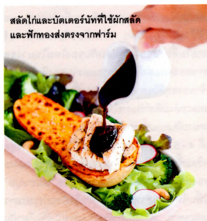
สลัดไก่และบัตเตอร์นัทที่ใช้ผักสลัดและฟักทองส่งตรงจากฟาร์ม